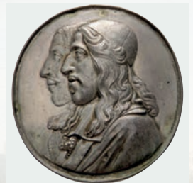
Johan en Cornelis de Witt herdenking politieke moord, 1672