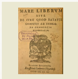
Mare Liberum - Vrije Zee (1609) Hugo de Groot