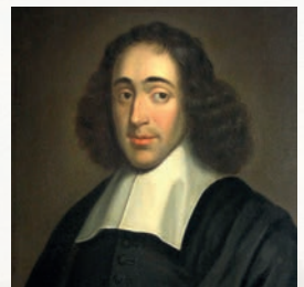
Benedictus de Spinoza detail schilderij Hollandse School