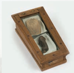
Tong en teen, gebroeders De Witt