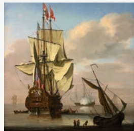
'Engels oorlogschip voor anker' schilderij W. van der Velde de Jonge