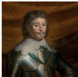
Stadhouder Frederik Hendrik detail schilderij Gerrit van Honthorst