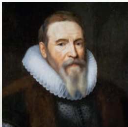
Johan van Oldenbarnevelt detail schilderij M.J. van Mierevelt