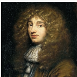
Christiaan Huygens detail schilderij Caspar Netscher